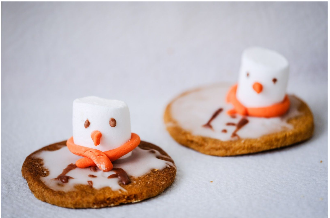
dochterlief had 'smeltende sneeuwpop'-koekjes gebakken