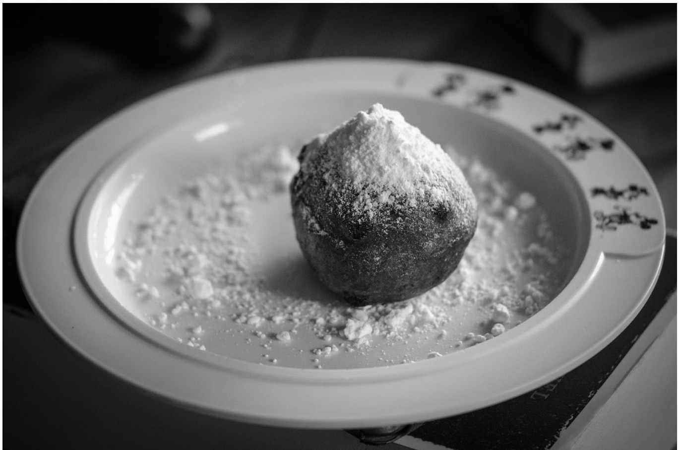
de laatste oliebol