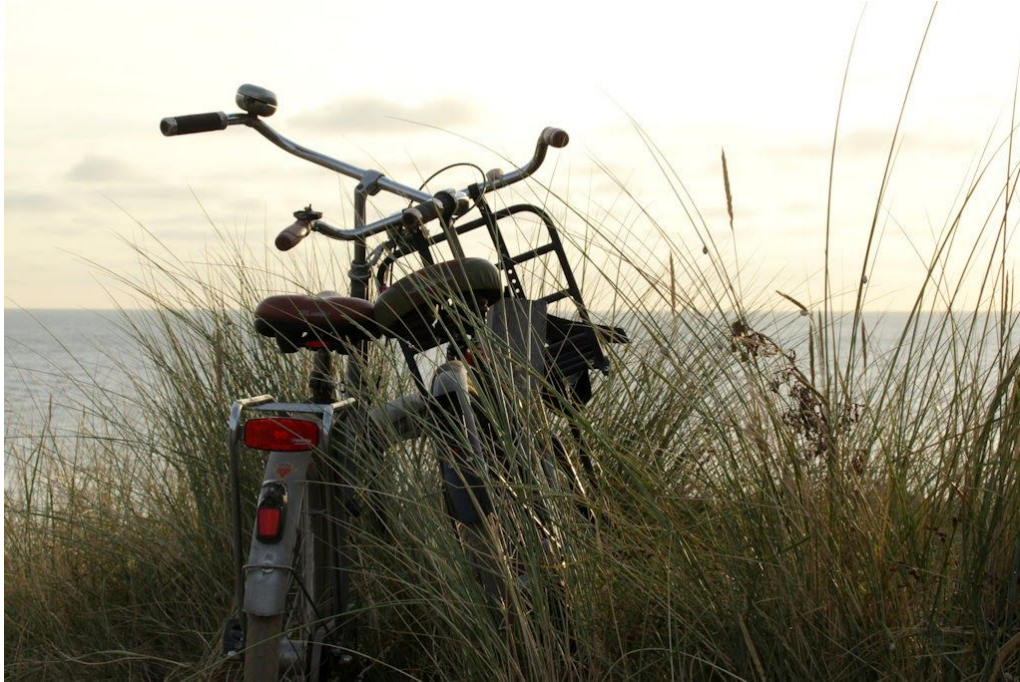
het thema was 'rust' - dit is de foto waarmee Arina de 3e prijs won

Iets meer dan een jaar geleden werd de laatste Zeeuwse fotosalon georganiseerd; deze vond alleen online plaats en dat bleek met terugwerkende kracht geheel corona-proof! Zoals jullie weten won Arina hierbij de derde prijs met haar mooie foto van 2 fietsen in de duinen. Omdat een fysieke prijsuitreiking afgelopen jaar niet mogelijk bleek, kreeg zij haar prijs onlangs thuisgestuurd: een mooie afdruk van haar foto en een waardebon voor een workshop bij Karin den Boer.